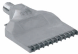
标准不锈钢吹风喷嘴