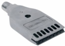
池内双排孔吹风喷嘴