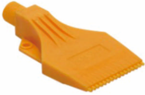
标准塑料吹风喷嘴