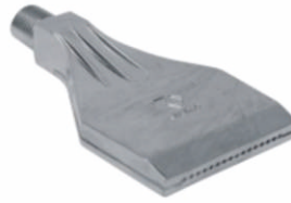
铝合金材质吹风喷嘴